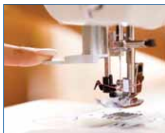
Автоматическая заправка нити.