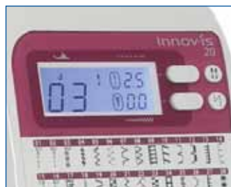
Четкое отображение важной информации на ЖК-дисплее.