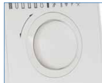
Электронный поворотный переключатель позволяет быстро и просто выбирать необходимые строчки.