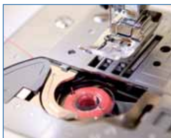
Быстрая установка шпульки. Просто установите шпульку, и можно начинать шитье.

Высокая скорость шитья - достигает 850 стежков в минуту.